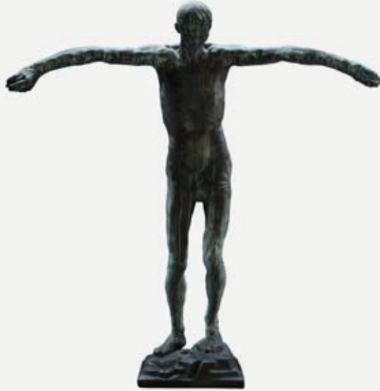
Anton Hanak, Der letzte Mensch (Ecce Homo), 1917-1924, Bronze.